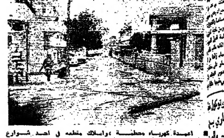
مبنى وادي عصبه مخرباً مخصصة، وإسلاك منظمه في احد شوارع